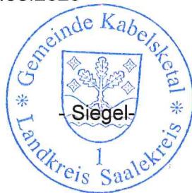
- Kunnig - Bürgermeister